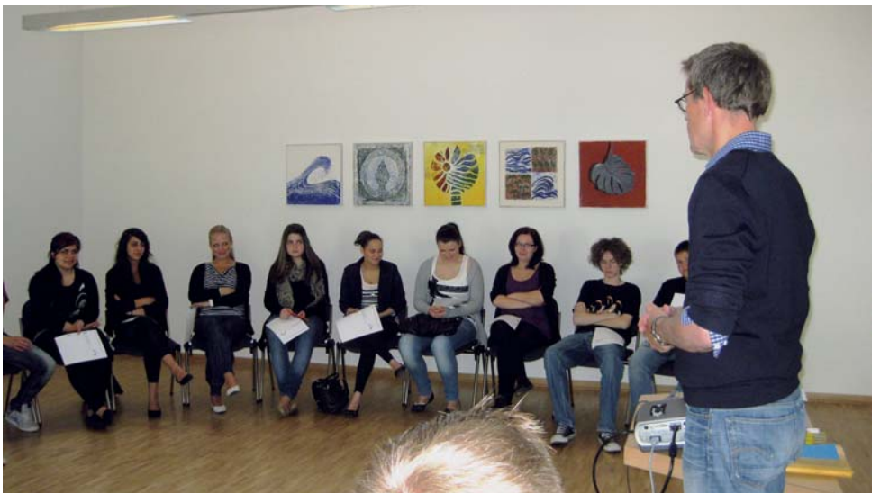
Einblick in das Bewerbertraining

Die Rotary Clubs haben sich darauf verständigt, das Programm für zunächst fünf Jahre zu organisieren und zu finanzieren, um jungen Menschen mit problematischem Lern- oder Lebens-Hintergrund eine Chance für ihre berufliche Zukunft zu geben. Zugleich möchten sie damit ein Zeichen setzen für eine stärkere Förderung dieser Heranwachsenden, auf deren Leistungsbereitschaft und Leistungsfähigkeit die Gesellschaft schon aus demographischen Gründen in den kommenden Jahrzehnten besonders angewiesen sein wird.