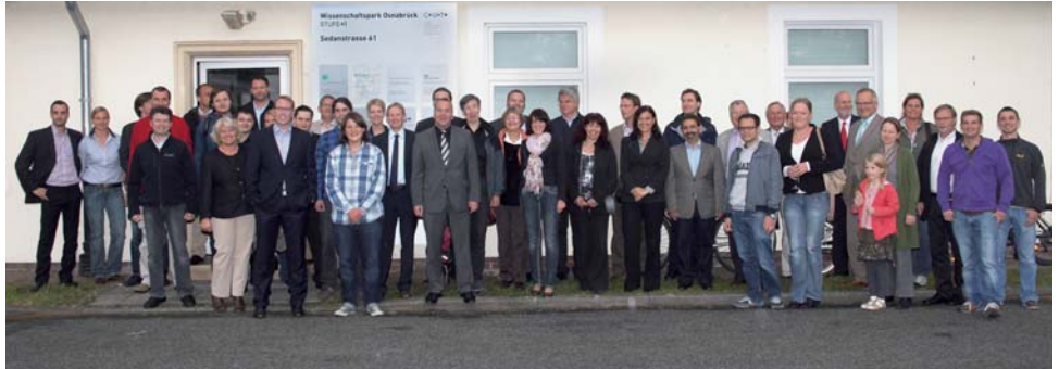
Grillfest in der „Stufe 1“ des Wissenschaftsparks Osnabrück

B ereits seit einem Jahr besteht die sogenannte „Stufe 1“ des Wissenschaftsparks Osnabrück. Bei einem Grillfest mit den 13 dort ansässigen Unternehmen griff Oberbürgermeister Boris Pistorius besonders den Fortschritt bei der Entwicklung des Wissenschaftsparks Osnabrück insgesamt auf.