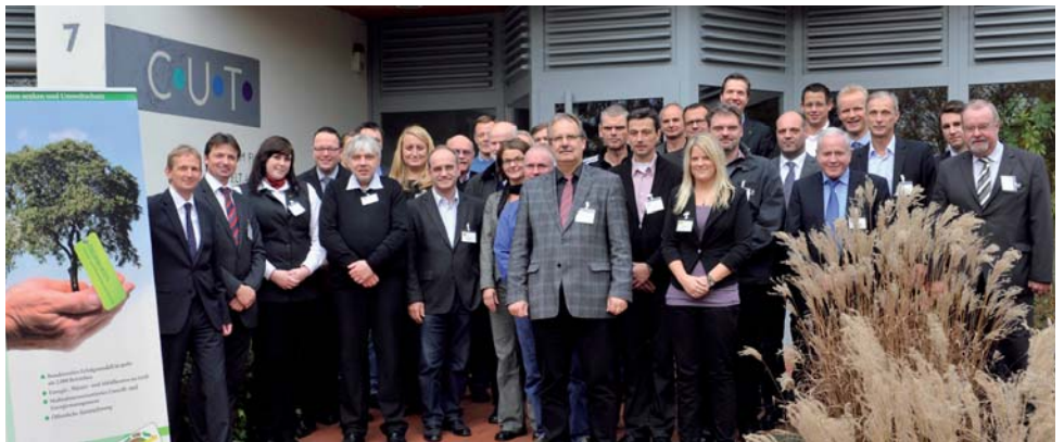
Unternehmensvertreter und Kooperationspartner bei der Auftaktveranstaltung von ÖKOPROFIT Osnabrück am 2. November 2011

Die Teilnehmer werden sich in acht Workshops intensiv mit Fragen des betrieblichen Umweltschutzes und nachhaltiger Unternehmensführung auseinandersetzen. Unterstützt durch einen erfahrenen Berater werden die Unternehmen und Institutionen ein jeweils individuelles betriebliches Umweltprogramm mit konkreten Maßnahmen entwickeln und das in der mittelständischen Praxis bewährte Umweltmanagementsystem ÖKOPROFIT einführen. Zum Abschluss der ein-